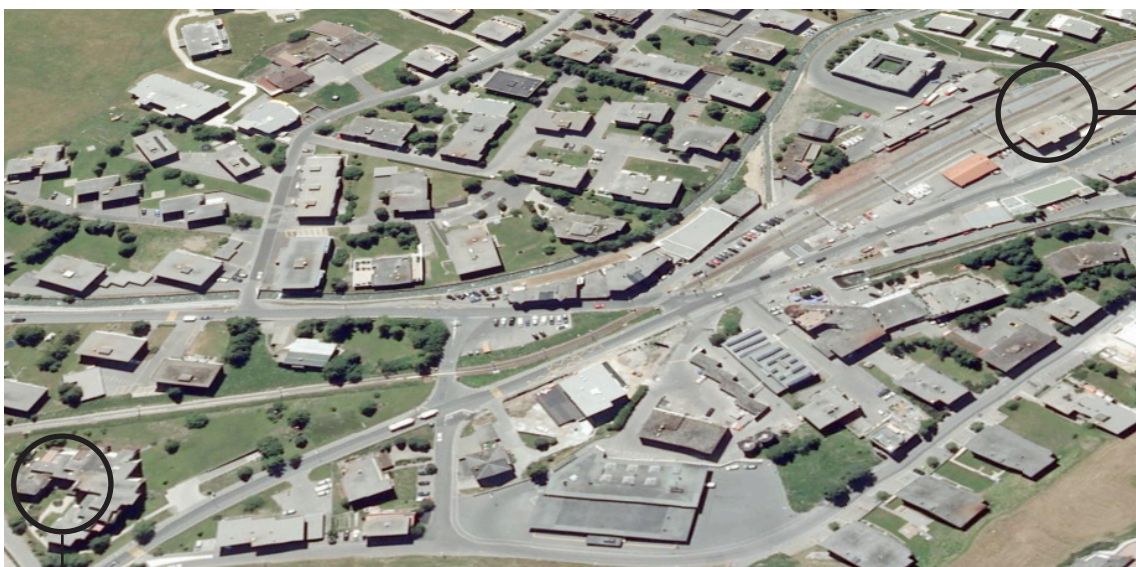
Bahnhof Davos Dorf

Der Bahnhof Davos Dorf befindet sich nur wenige Gehminuten von der Wohnung entfernt. Bis Landquart fahren Sie mit den Schweizerischen Bundesbahnen (SBB), danach mit der Rhätischen Bahn (RhB) bis nach Klosters oder Davos.